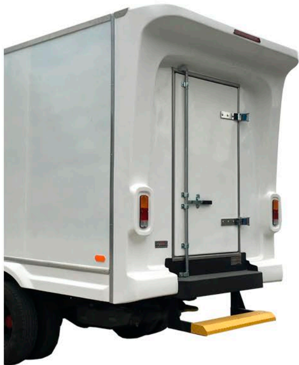
Acabado externo metálico con pintura sintética color blanco.