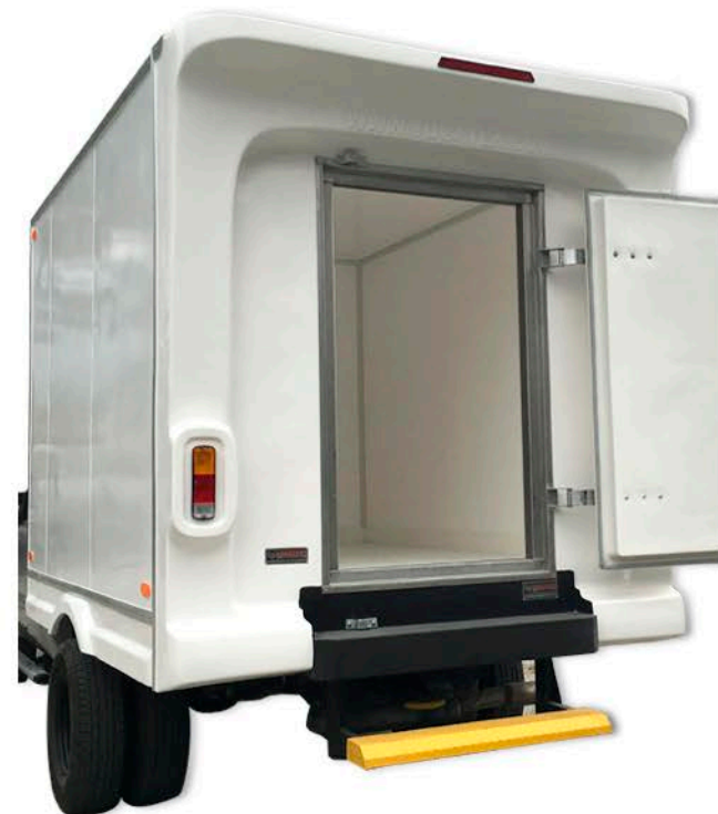
Acabado interno en fibra de vidrio, con la misma calidad de todas nuestras cavas.