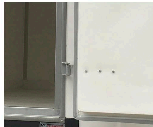
Tornillos pasantes en bisagras.