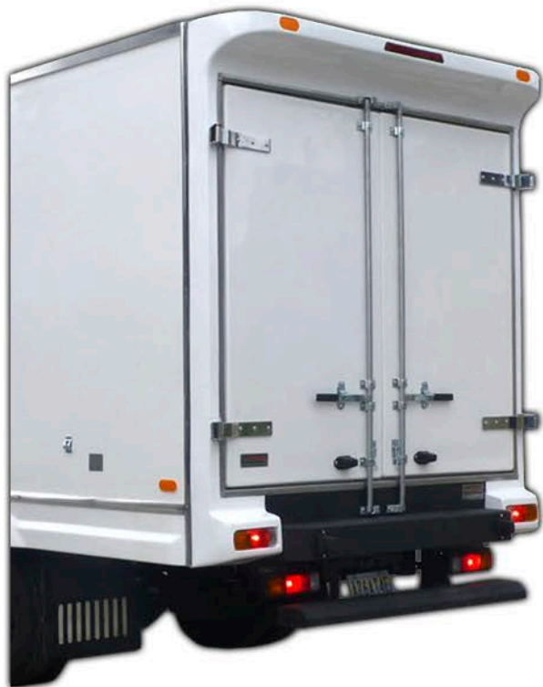
Sistema de cierre de doble punto en cada puerta de la cava.