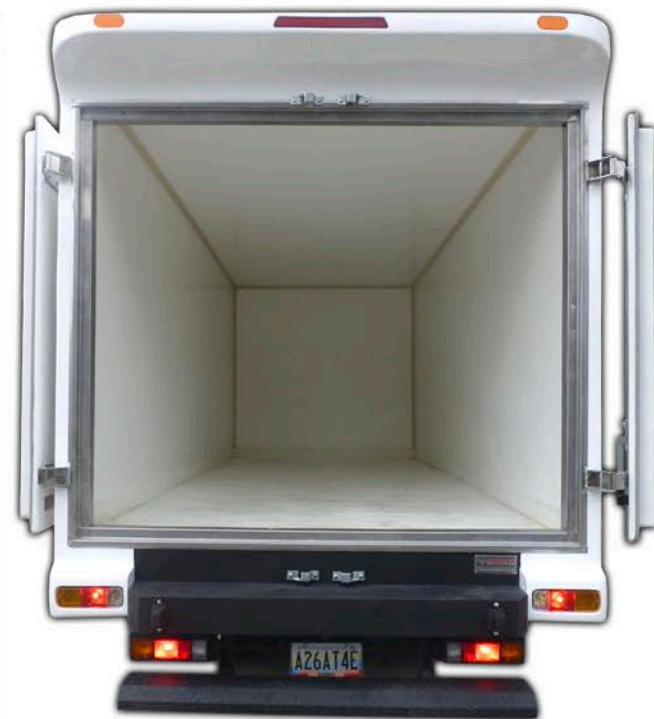
Puertas con apertura total, para facilitar la carga con montacarga y transpaleta.